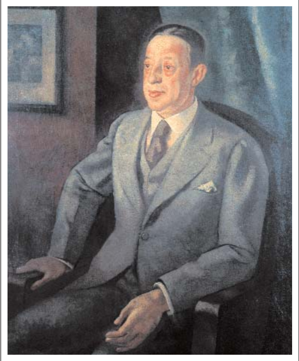
Obra de Daniel Vázquez Díaz