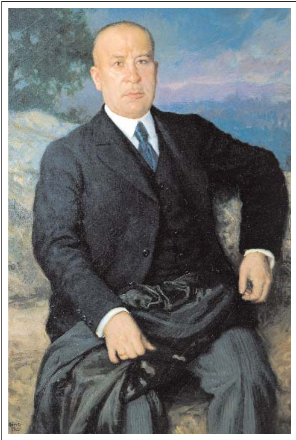
Obra de Juan José Gárate