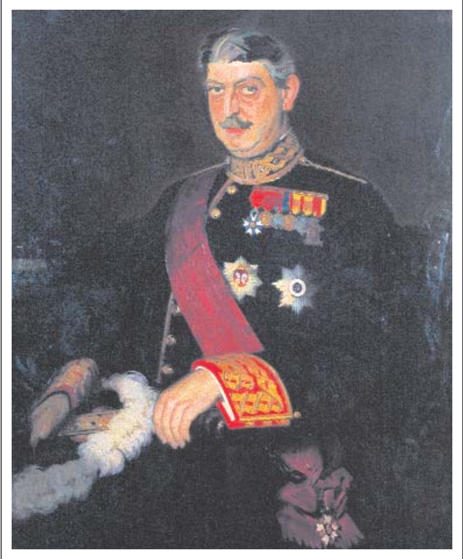
Obra de Francisco Soria Aedo