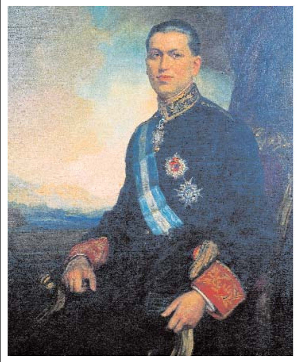
Obra de Fernando Álvarez de Sotomayor