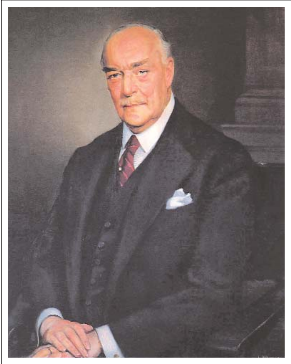
Obra de Luis Mosquera Gómez