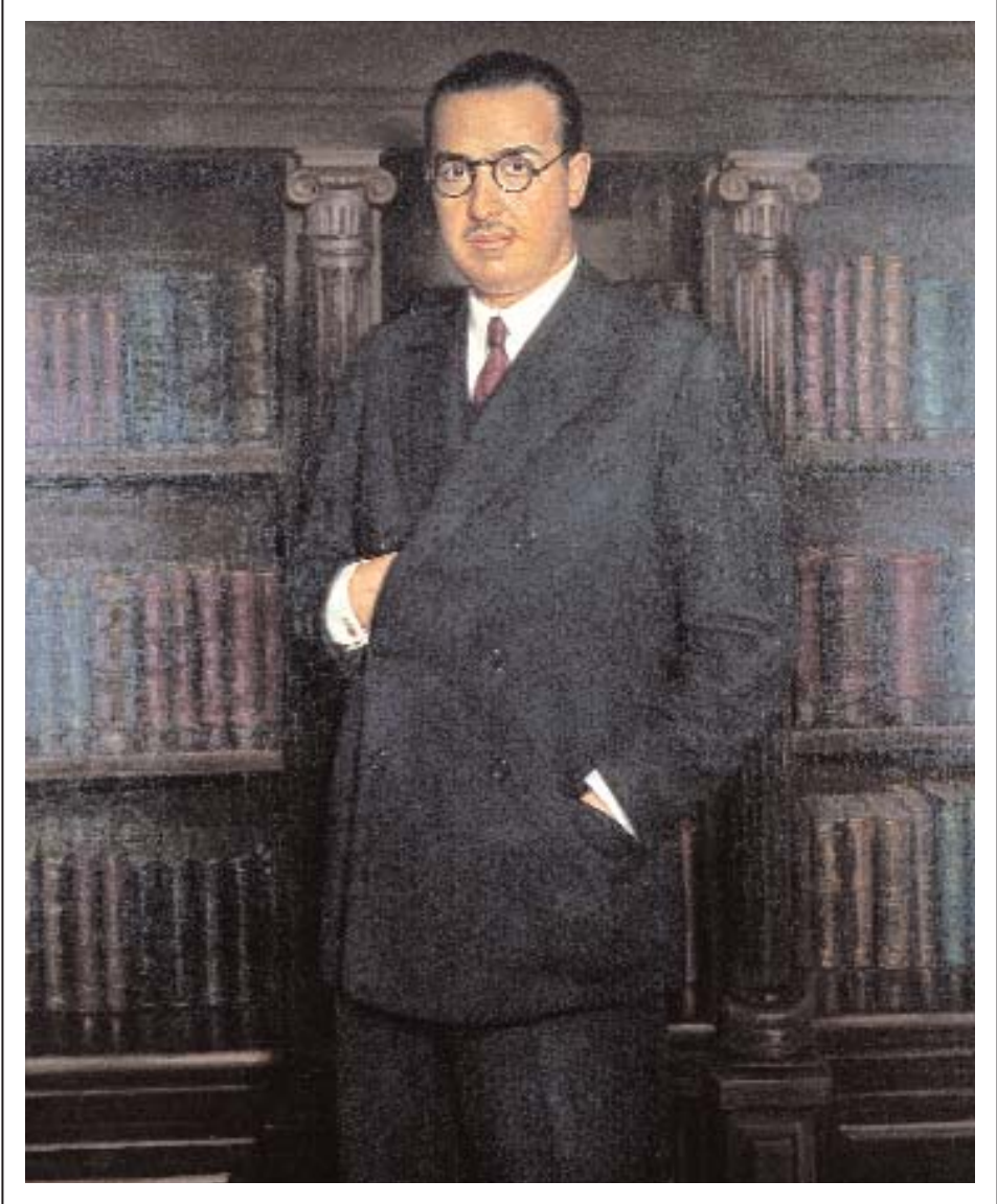
Obra de A. Castellanos