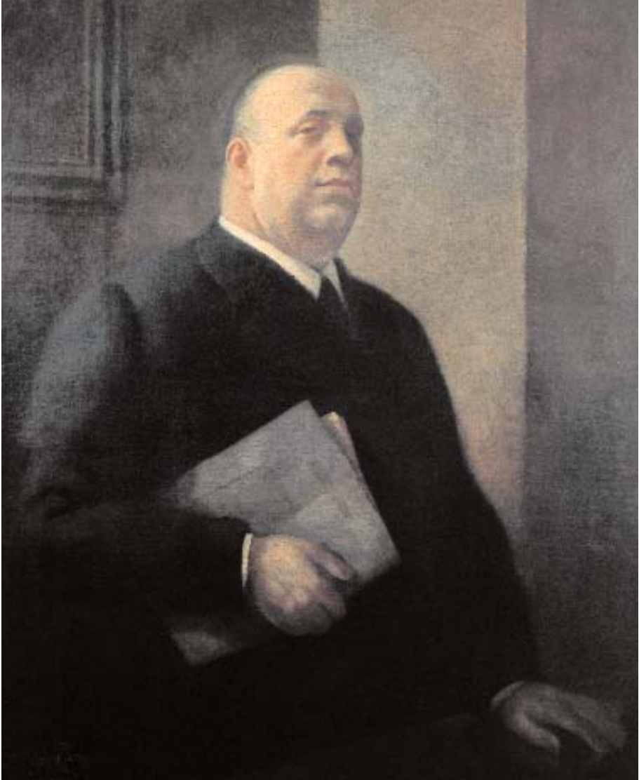
Obra de Daniel Vázquez Díaz