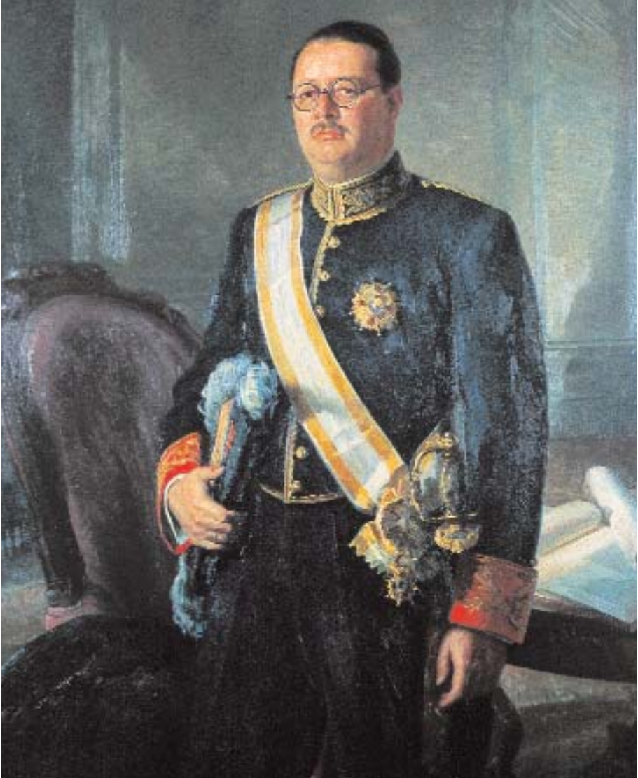
Obra de Julio Moisés Fernández